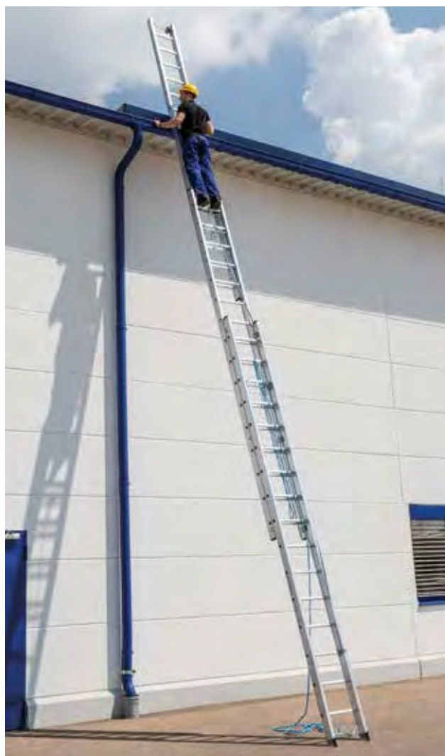
Артикул № 22316