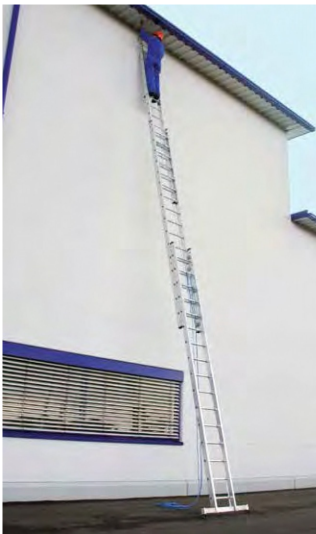
Артикул № 22416