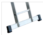
Артикул № 21614