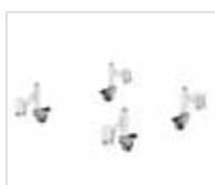
Артикул № 50036