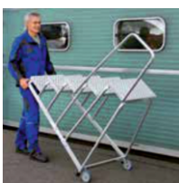
Артикул № 51038 с 50041