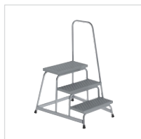
Артикул № 51036