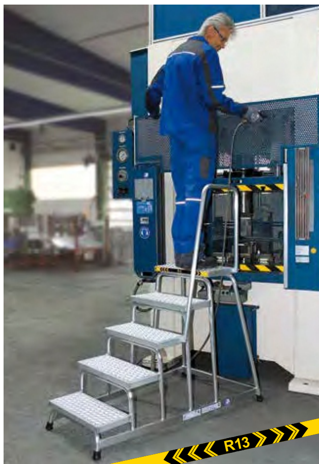
Артикул № 51038