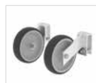
Артикул № 50041