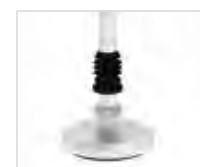
Артикул № 50042