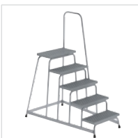
Артикул № 51038