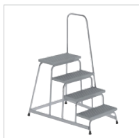
Артикул № 51037