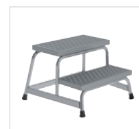
Артикул № 51031