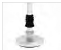
Артикул № 50042