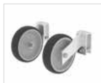
Артикул № 50041