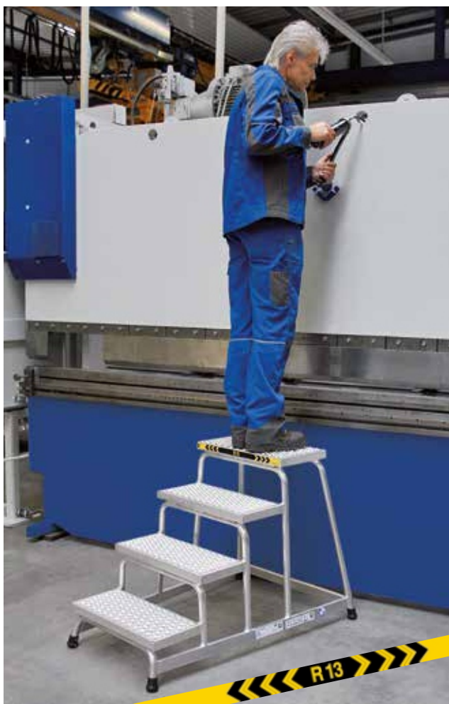
Артикул № 51033

Прочная, сварная конструкция рамы, ступени из алюминия. Безопасные ступени с сертифицированной нескользящей поверхностью R 13.