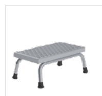
Артикул № 51030