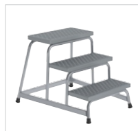
Артикул № 51032