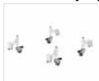
Артикул № 50036