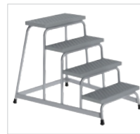
Артикул № 51033