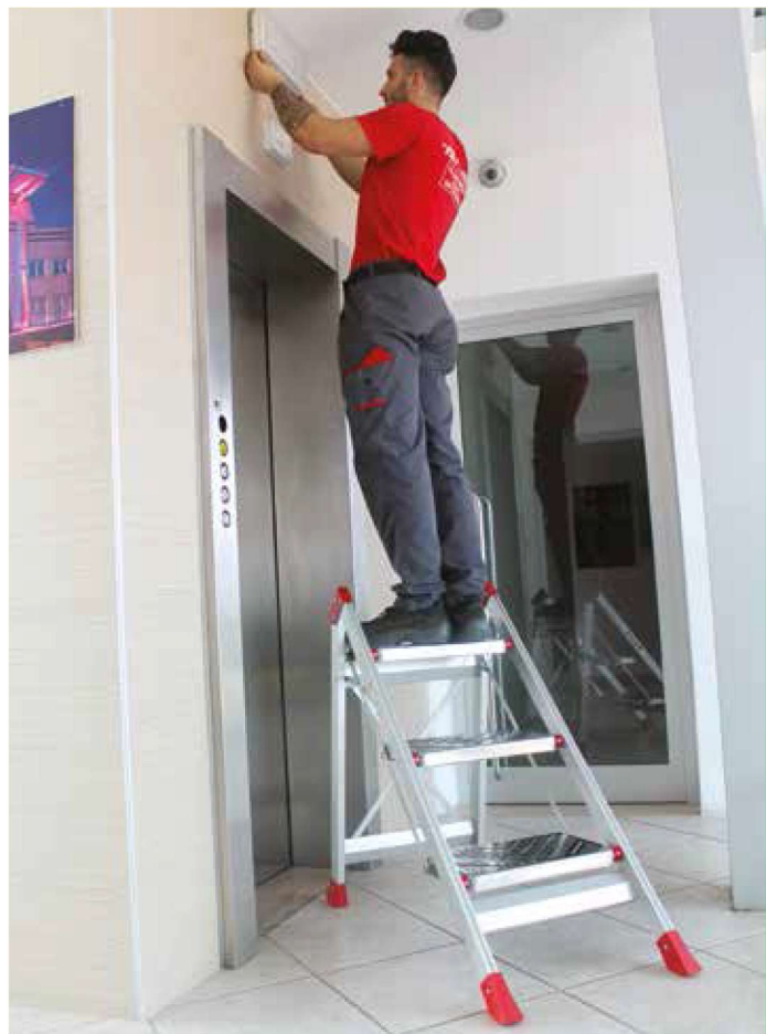
Uniwersalny w każdej sytuacji, gwarantuje stabilność i bezpieczeństwo. Versatile in any situation, it guarantees stability and safety.