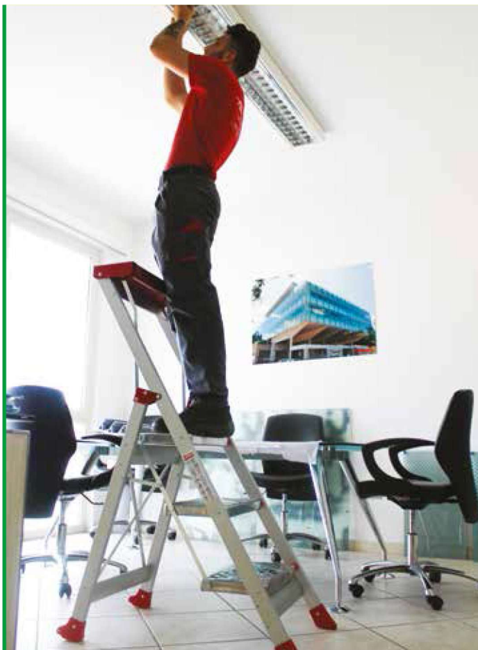
Krzyżowy system stabilizacji. Cross-stabilising system.